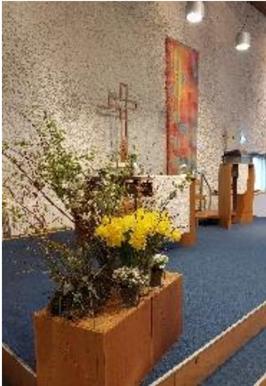
Lia Hulshof en Til Koen

Een bijzondere feestelijke schikking met veel bloeiende lentebloemen zien we met vooral de veelkleurige, vrolijke narcissen. Uitbundig om het zo samen te kunnen gaan vieren! “De Heer is waarlijk opgestaan!” PASEN! PAASFEEST!